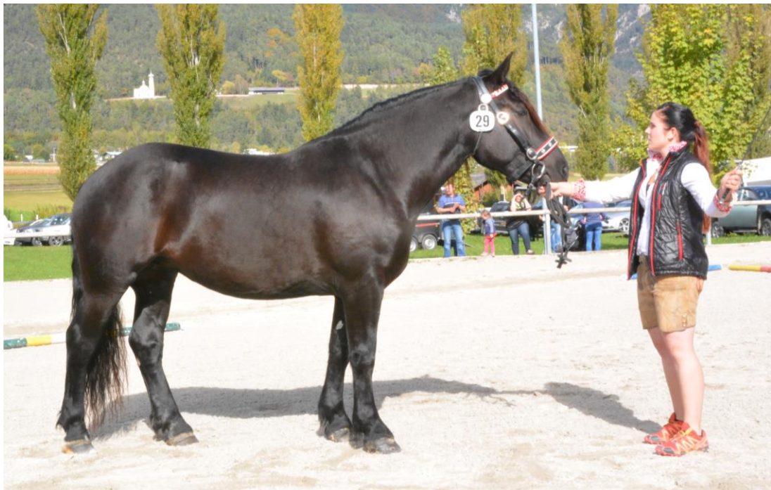
Odessa, Arthur Thöni, Telfs Vater: Zitter Schaunitz XVI