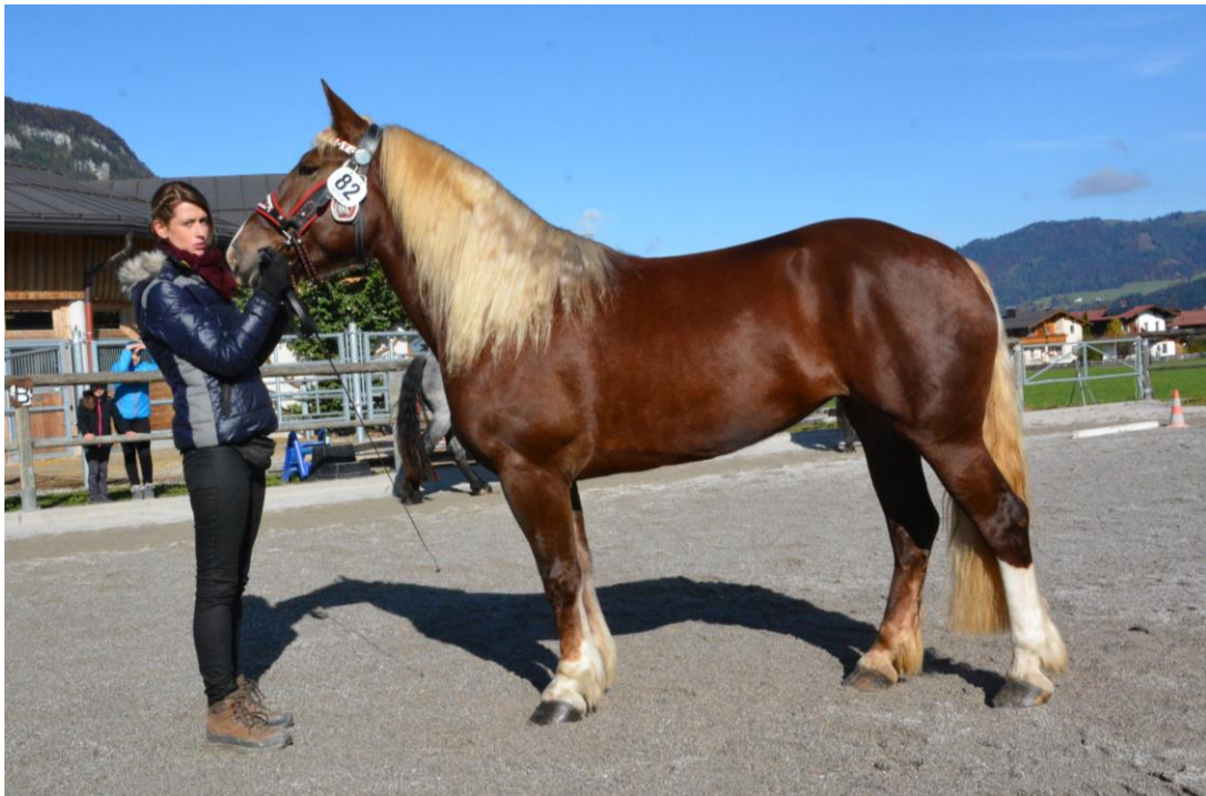
Lore, Flörl Nadine, Ried Vater: Siller VulkanXVII